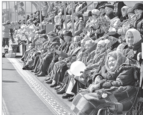
Поколение победителей. Судьба каждого - на вес золота.