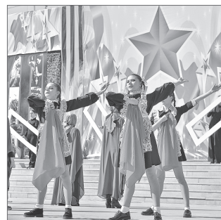
Михаил Плещкий. Фото автора.