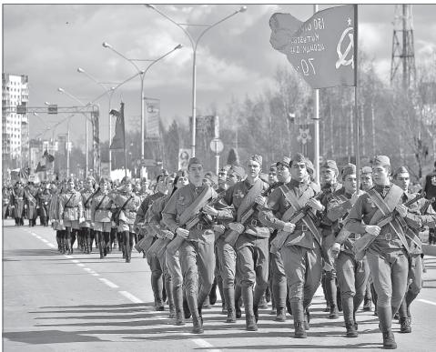
Великая честь для школьников - пройти маршем перед ветеранами.