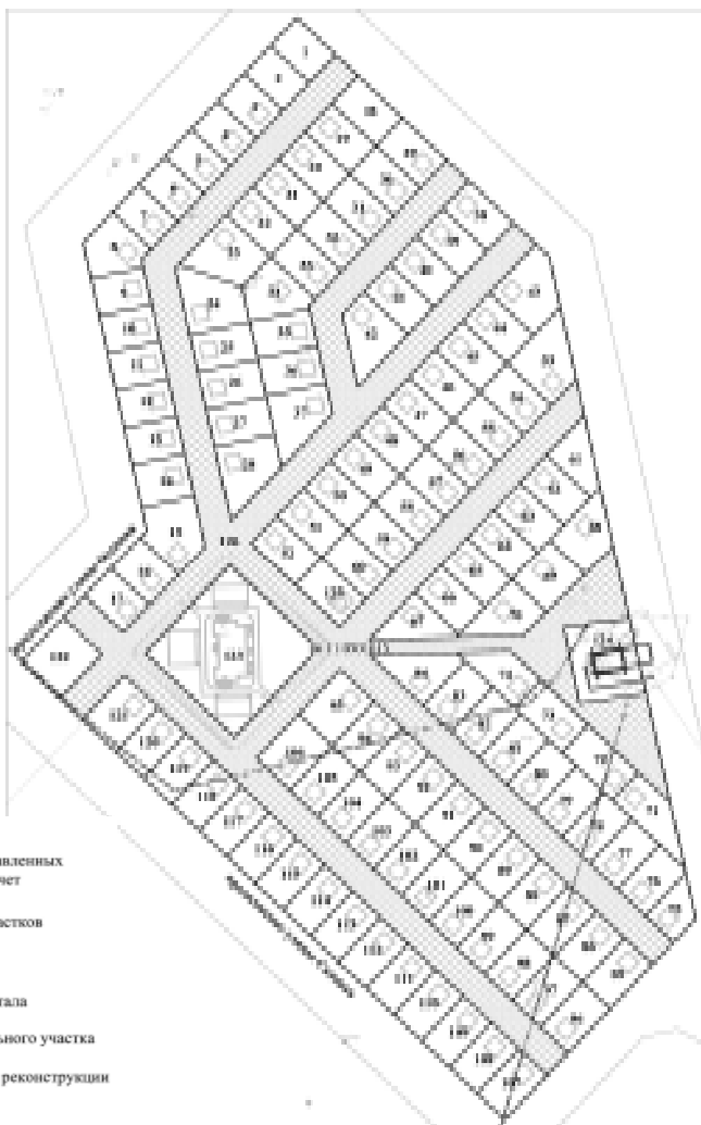
Чертеж образования земельных участков