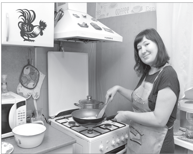
Жильцы второго микрорайона позитивно отнеслись к замене газоснабжения на электричество.

На заседаниях профильных комитетов депутаты рассмотрели ряд вопросов, не вошедших в повестку дня ноябрьской Думы. Один из них было предложено вернуть на доработку, речь идёт о компенсации расходов на приобретение и подключение электрических плит в 1 и 2 микрорайонах при переводе многоквартирных домов с газового на электроснабжение. Жители этой части города уже не первый год обращаются в администрацию и к депутатам с такими просьбами. Население, выбирая между газом и электричеством, отдаёт предпочтение последнему.