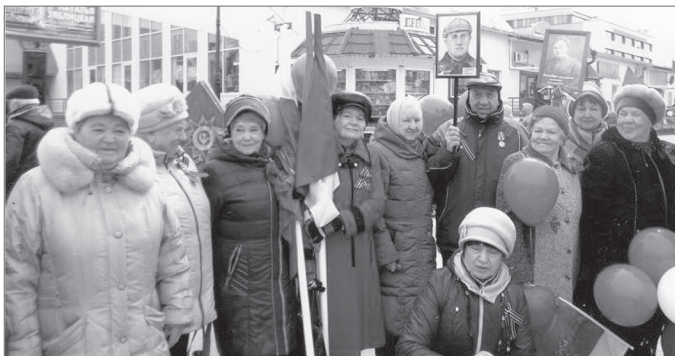
На праздничной демонстрации в честь Дня Победы.