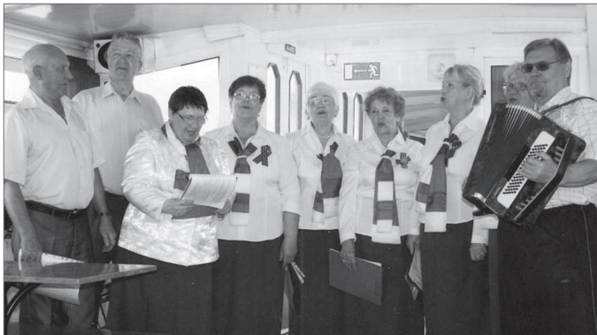
Ансамбль «Ветеран» на теплоходе.

В конце ноября общественная организация «Ветеран» города Нижневартовска отметила четырёхлетие со дня своего образования. Она объединила более 300 ветеранов труда России и округа, участников Великой Отечественной войны, детей войны, ветеранов вооружённых сил, старожил города, заслуженных работников разных отраслей. На протяжении своей деятельности организация всегда тесно сотрудничала и провела множество совместных мероприятий с Думой города.