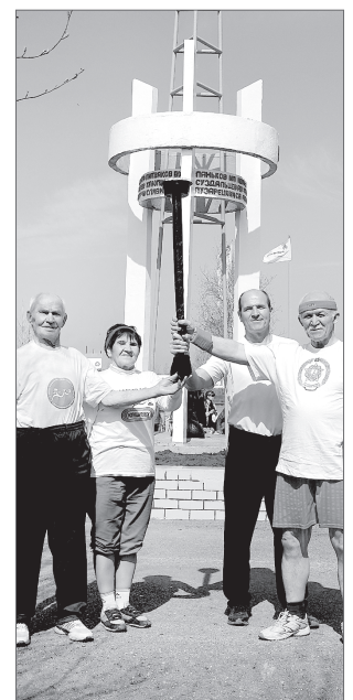
Людмила Подройкова.