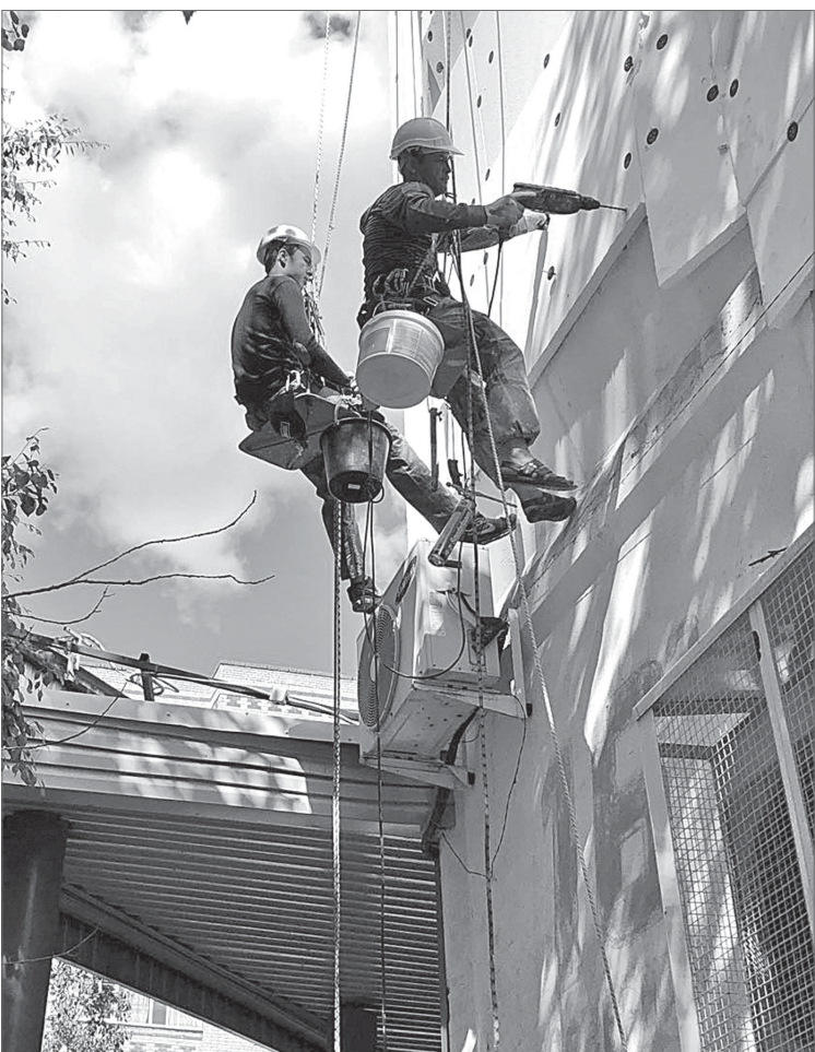
Им покоряются высоты.