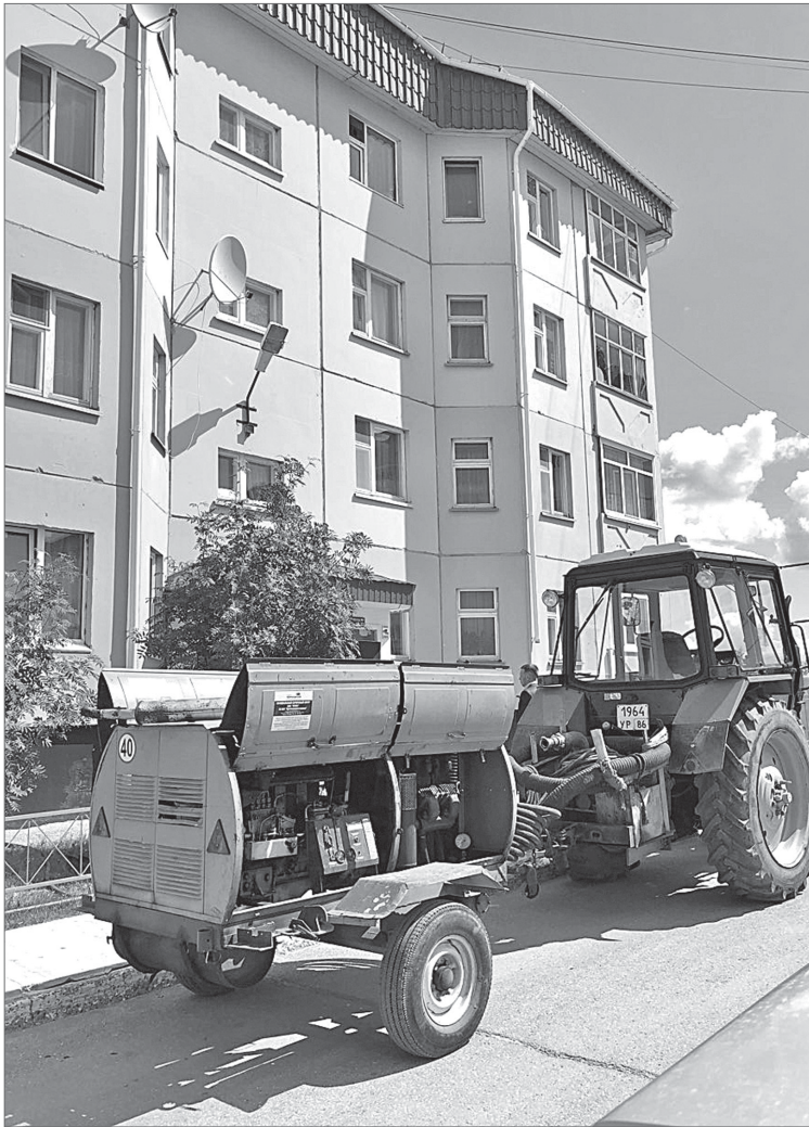
Вот-вот зашумит компрессор и начнутся испытания.

Нижневартовск готовится к зиме. Летом все системы жизнеобеспечения в жилом фонде города, как и положено в крепком хозяйстве, силами коммунальных служб приводятся в порядок. Журналисты «Варты» побывали во дворах многоквартирных домов МУП «ПРЭТ №3» и понаблюдали, как проводятся гидropневматические испытания систем отопления и утепление фасадов.