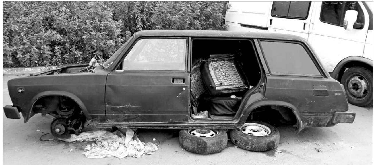
Перечень брошенных транспортных средств по состоянию на 7.05.2020, расположенных на территории микрорайонов и подлежащих перемещению на специализированную стоянку

- на юридических лиц - от 20 тысяч до 50 тысяч рублей.