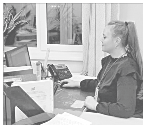
Управление по жилищной политике администрации города Нижневартовска.