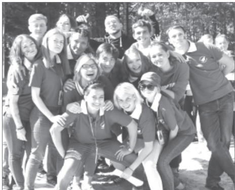
Вожащие - это не только генераторы идей, но и главные мечтатели лагерной смены.

Им всем от восьми и до пятнадцати лет. Неподходящие друг к другу в своих вкусах и интересах, они едины желанием лететь за мечтой, доказывая мамам и папам, что и в черте города, при желании, можно отдохнуть и зарядиться эмоциями перед началом нового учебного года.