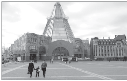
Полоса подготовлена АУ ХМАО - Югры «Центр «Открытый регион». Инфографика Фариды Чешковой.

казывает устойчивое социально-экономическое развитие, демонстрирует рост по основным показателям качества жизни, исполнению наказов президента, например, в строительстве детских садов - родителям уже не нужно занимать очереди в сады ещё до рождения малыша, все дети с трёх до семи лет обеспечены садами. Югра - в группе лидеров инвестиционного рейтинга страны, и это - залог высоких доходов жителей. Средний доход нашего бюджетника в 1,8 раза выше, чем в среднем по стране. При этом средняя заработная плата за шесть лет выросла в два раза! А уровень безработицы - один из самых низких в стране. Неудивительно, что в Югре хотят жить, работать, создавать семьи. Каждый год в нашем округе появляется на свет в пять раз больше детей, чем в среднем по России! Из округа стали реже уезжать. Даже пенсионеры, в своё время уехавшие из Югры, возвращаются обратно. Специалисты из других регионов хотят получить здесь работу. Кроме того, у югорчан есть все возможности создавать собственное дело, реализовывать свои инвестиционные проекты, развивать социальное предпринимательство.