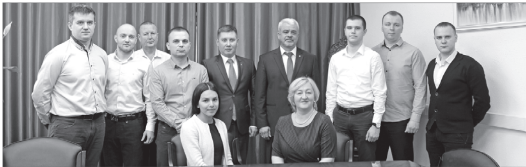
Коллектив геологической службы ЦДНГ-7.

Завтра все геологи России будут отмечать свой профессиональный праздник. Для нижевартовских геологов этот день особенно значим, ведь учредили его в 1966 году, когда на Самотлоре стараниями геологов забил первый фонтан промышленной нефти.