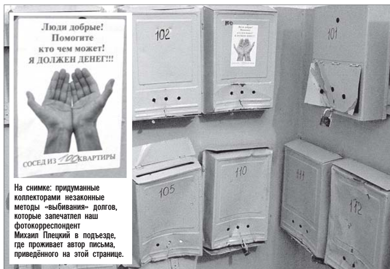
На снимке: придуманные коллекторами незаконные методы «выбивания» долгов, которые запечатлел наш фотокорреспондент Михаил Плецкий в подъезде, где проживает автор письма, приведённого на этой странице.

Что мне делать в таком случае, как защитить себя от этого произвола?».