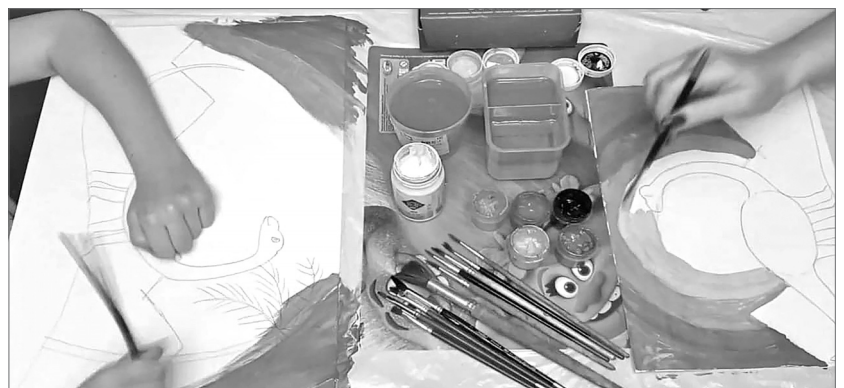
Следим за руками в рубрике «КАРТинки на карантинке».

Центр национальных культур выложил на своей страничке ВКонтакте ссылку на проект «Письмо деду», организованный для всего Уральского федерального округа. Всем предлагают написать письмо своему родственнику, воевавшему на фронте или трудившемуся в тылу, восстанавливавшему города и сёла из руин, и рассказать в таком письме о дне сегодняшнем. О том, как изменилась наша жизнь, чем живёт юное поколение, или просто высказать слова благодарности за жизнь и мирное небо над головой. Самые трогательные истории станут частью документального фильма Свердловской киностудии, посвящённого 75-летию Великой Победы. Письма принимаются на сайте урфодома.рф до 17 мая включительно по ссылке: https://урфодома.рф/9may .