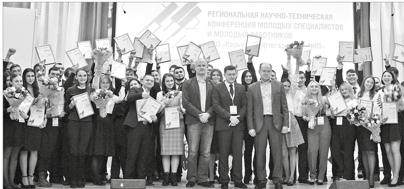
Сделать свой проект прорывным и жизнеспособным, доказать, что именно твоя научно-техническая разработка достойна реализации на производстве, – вот цель каждого участника.

Как добыть трудноизвлекаемые запасы нефти? Без науки на этот вопрос точно не ответить. Ну, а самыми яркими научными идеями, конечно, фонтанирует молодёжь. На днях молодые специалисты группы предприятий «Варьёганнефтегаз» НК «Роснефть» собрались на региональную научно-техническую конференцию.