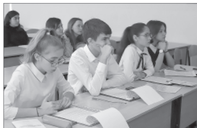
Значительно возрастут расходы на образование - более чем на 150 млрд рублей.

Подходит к завершению очередной финансовый год, и как всегда, это время формирования бюджетов на следующий период на всех уровнях законодательной и исполнительной власти.