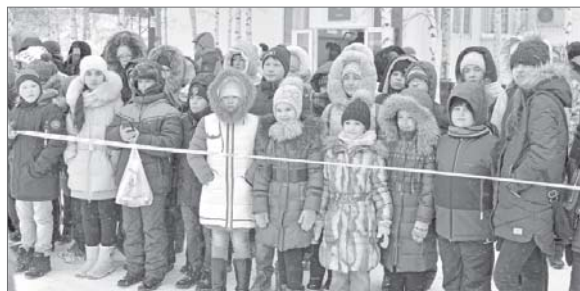
Затаив дыхание, мальчишки и девочки следят за происходящим.