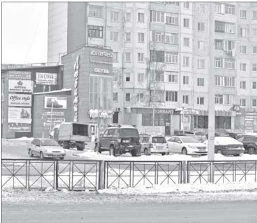
Предстоит также в районе Сбербанка со стороны 7 микрорайона обустроить подходы к светофорному объекту и проложить тротуары до автобусных остановок и регулируемых пешеходных переходов.

В редакцию «Варты» пришло письмо от жителей 7 и 10-а микрорайонов, которые написали о своём несогласии с тем, что в конце прошлого года на улице Интернациональной в створе улиц Нефтяников и Дзержинского были закрыты два нерегулируемых пешеходных перехода. Один из переходов находился в районе здания МТС, другой - недалеко от дома №41. Вместо этих объектов напротив центрального отделения Сбербанка был оборудован один пешеходный переход со светофорным регулированием. Жители соседних кварталов, привыкшие за много лет переходить дорогу в ранее установленных местах, теперь недовольны новым пешеходным переходом.