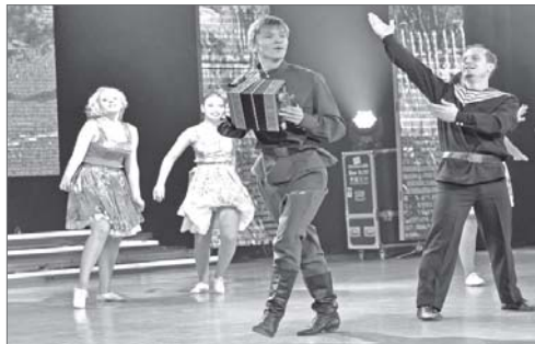
Концертная программа творческих коллективов Дворца искусств - подарок старшему поколению от нефтяников «Самотлорнефтегаза».