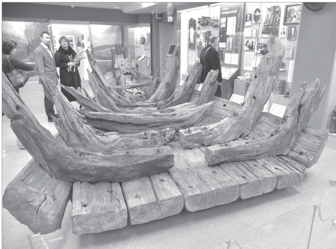
Масштаб объекта можно оценить, осмотрев результат многолетней работы по реставрации Кирьясской барки. В Нижневартовском краеведческом музее им. Т.Д. Шуваева на всеобщее обозрение выставлена 1/8 носовой части судна. О том, как идет реставрация кормы, читайте в ближайших номерах «Варты».