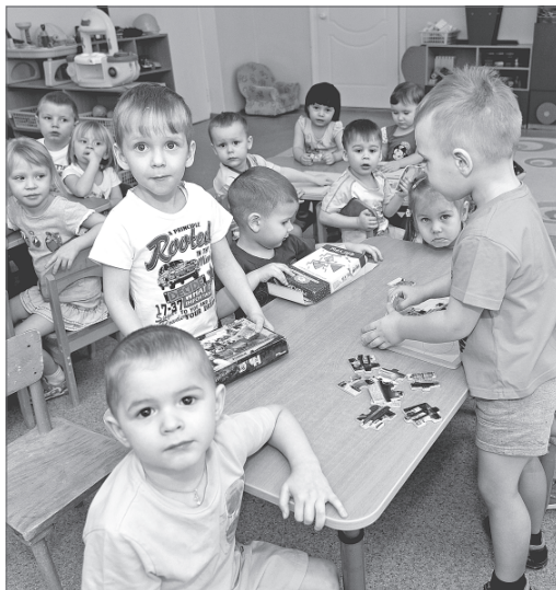
Юным вартовчанам в детских садах должно быть интересно и комфортно, считают народные избранники.

Так, например, по мнению родителей, в Нижневартовске необходимо открывать группы круглосуточного пребывания малышей. Они будут очень востребованы у мам и пап, у которых сменный график работы, а также у тех, кто воспитывает детей в одиночку. Предложение, как считают участники встречи, заслуживает внимания. В ближайшее время займутся его проработкой.