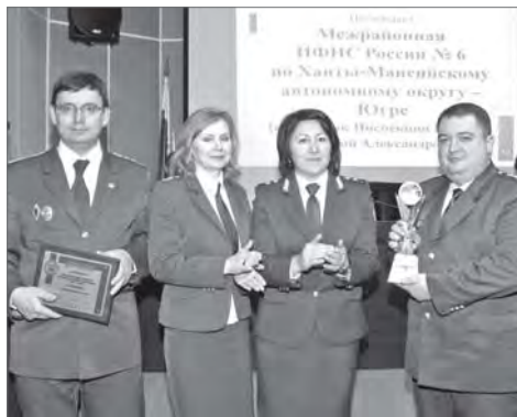
Сотрудники межрайонной налоговой инспекции №6 на награждении в Ханты-Мансийске.