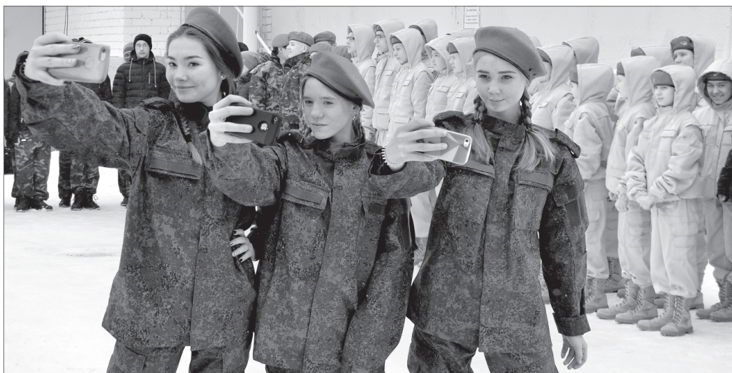
Селфи с хэштегом #Я-юнармеец уже разлетелось по просторам Интернета, объединив таких же молодых и энергичных патриотов всей России.

В Нижневартовске состоялся первый слёт активистов патриотического и юнармейского движения. Кроме соревновательной и образовательной части, двадцать его участников ждал особенно волнительный момент - торжественное принятие их в ряды юнармейцев.