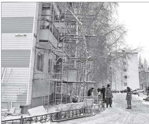
Создан отдельный реестр организаций, недобросовестно выполнивших работы по капитальному ремонту домов. В него вошла и та фирма, которая занималась ремонтом фасадов домов на ул. Омской, 22-а, Менделеева, 28-а и Чапаева, 51.