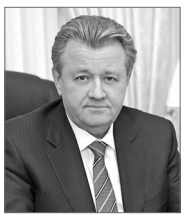
Василий Тихонов, глава Нижневартовска:

это газ, электричество, биологическая энергия? – на целых два часа молодые люди окунулись в интересные факты, цифры из жизни планеты, России, округа и любимого города и размышляли об экологии, добыче нефти, мировой экономике. Одно важно – нам с нашей планеты деваться некуда, поэтому нужно думать, как сберечь её ресурсы. Вот задача номер один для молодых умов.