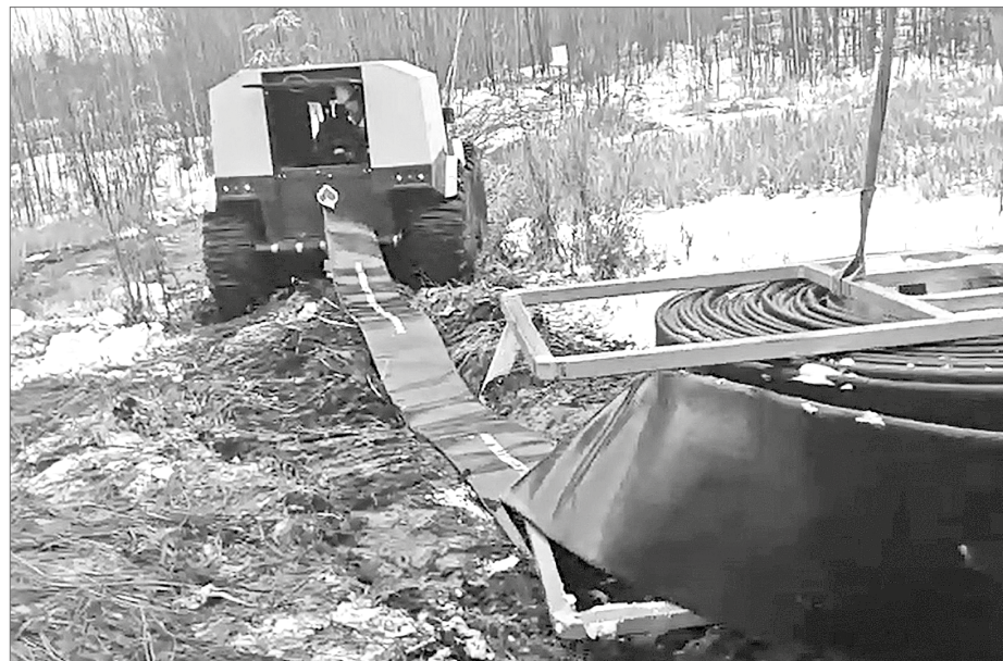
Плоскосворачиваемые рукава – новинка отечественного производства. Гибкие, износостойкие, они экономят время ремонтных работ и снижают потери нефтедобычи.

Нефтяники АО «Самотлорнефтегаз» нашли способ вести ремонт трубопроводов без остановки добывающего фонда. Снизить потери нефти им помогает временная линия нового поколения.