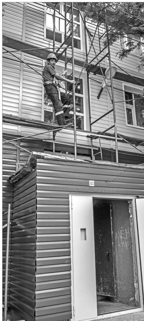
Дом на улице Интернациональной, 14-б стал выглядеть, как новый.

На сегодняшний день закончен капитальный ремонт в 24 жилых зданиях. В 47 многоквартирных домах работы в самом разгаре.