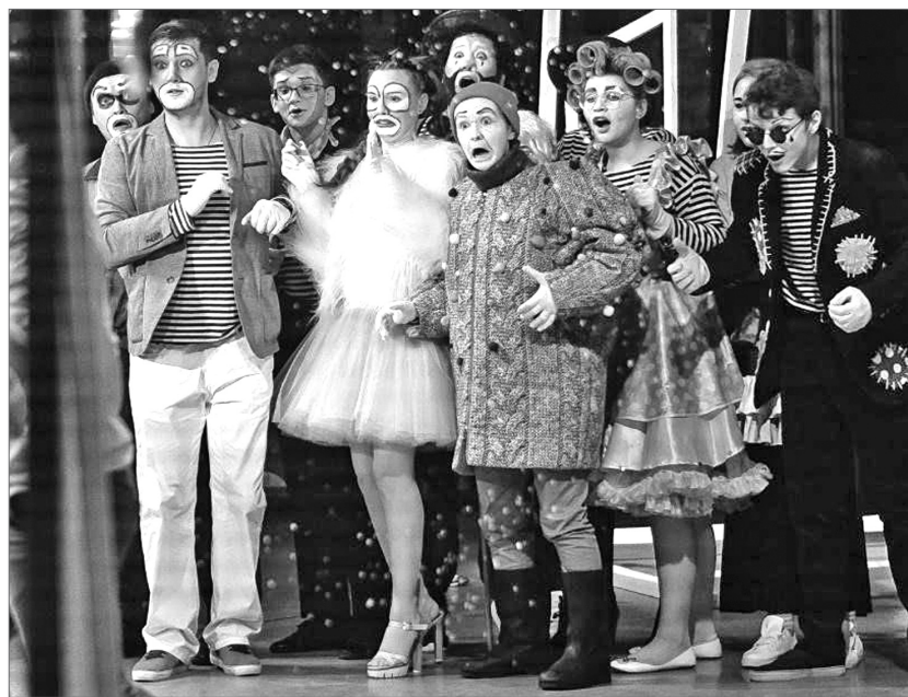
Творческая задумка - сделать зрителя частью театрального действия, для чего артисты театра прямо во время спектакля идут в зал.

– Я работаю с ребятами с 2010 года, и за это время они заметно выросли. Хотя в труппе и нет профессиональных актёров, все очень любят театр, и эта любовь видна из зрительного зала, – продолжает руководитель Молодёжного театра. – Публика встретила нас очень тепло, многие аплодировали стоя. Довольный зритель – лучшая награда как для режиссёра, так и для актёров».