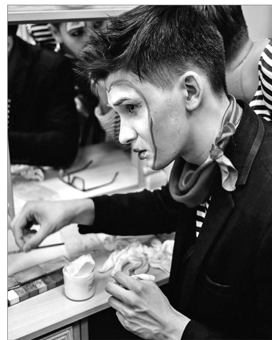
«Эффект маски»: лицом к лицу, от сердца к сердцу.