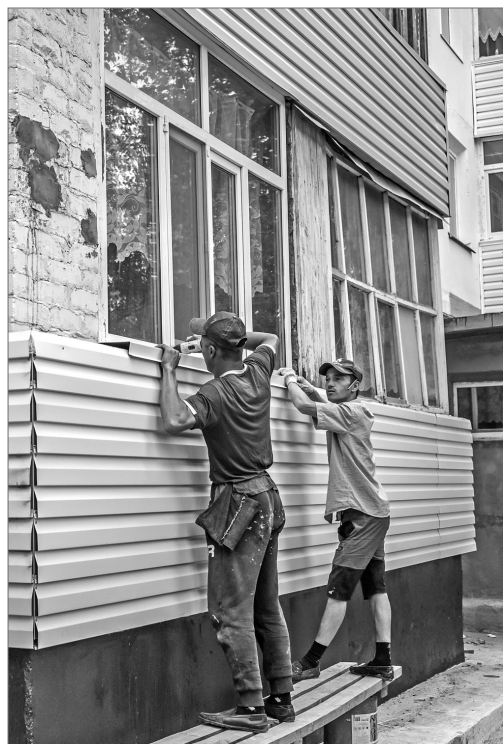
Обшивку фасада дома на улице Интернациональной, 8-б ремонтники стремятся закончить в срок.

115 нижевартовских домов вошли в программу капитального ремонта на 2019 год.