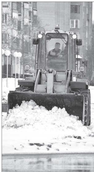
Управление по информационной политике администрации Нижневартовска.

Департамент экономики администрации Нижневартовска.