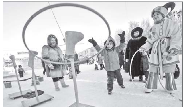
«Попадись в мой обруч, удача!»