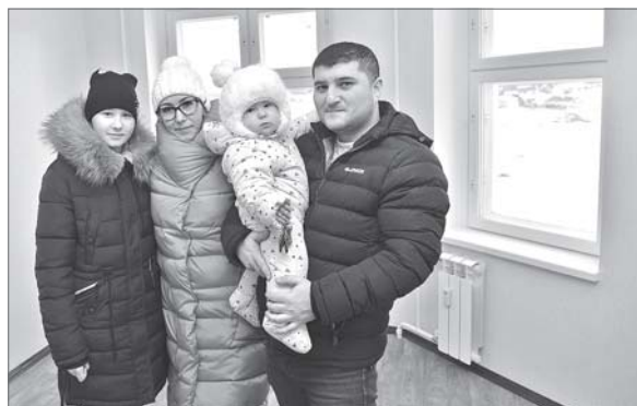
Звонят ключи в руках счастливых новосёлов. Когда люди много лет живут в ветхом жильё, получить комфортную квартиру в капитальном доме - просто огромная радость. И верится, что всё им теперь по плечу - жить, растить детей, работать на благо семьи и любимого города.