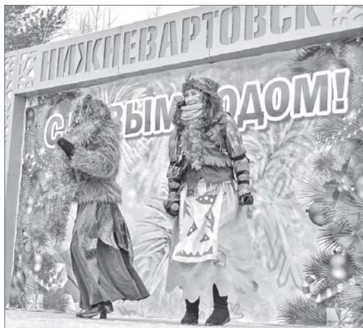
Рождественский сочельник нижевартовцы отметили вместе с артистами Центра национальных культур.