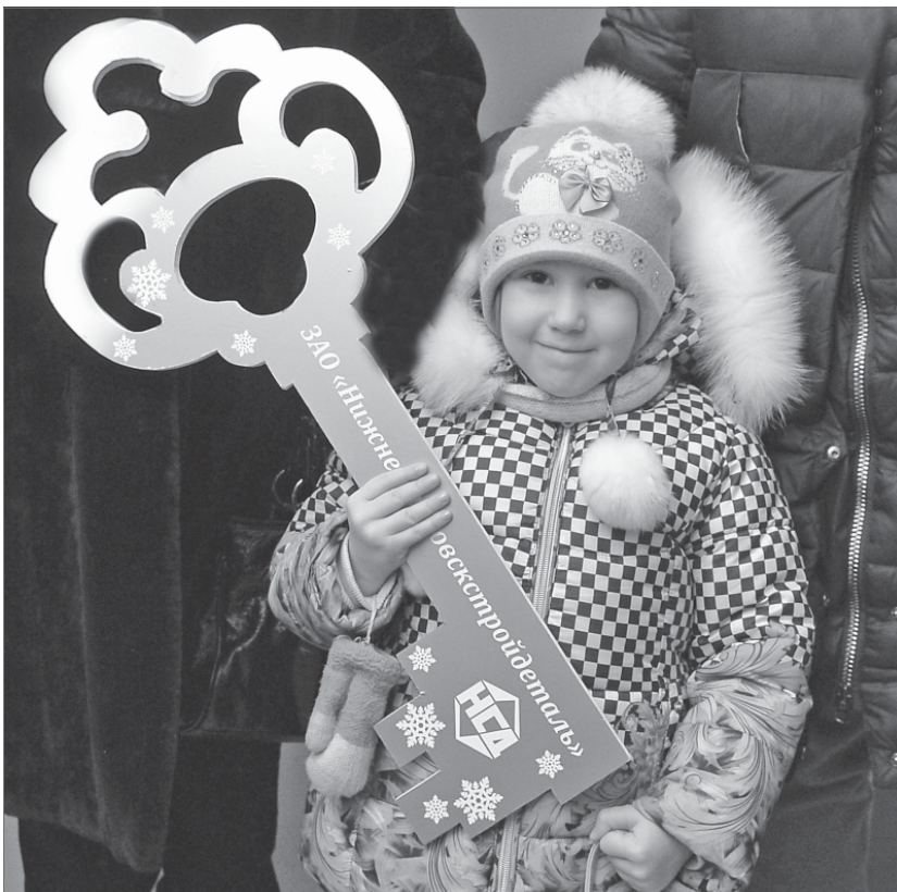
Держу крепко ключ от квартиры, где счастье поселится!