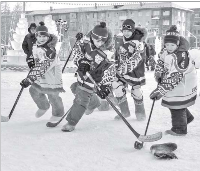
Вместо коньков - валенки, вместо шайбы - валенок... Однако и в такой игре нужны великолепная пятерка и вратарь