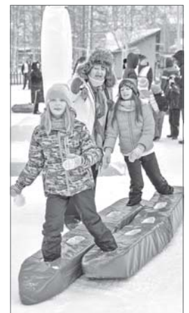
Истинное значение дружбы тебе открывается только тогда, когда у тебя одна пара лыж на двоих.