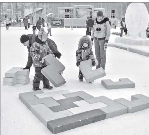
Кто сказал, что развивающие игры уместны лишь за письменным столом? Снег логике не помеха!