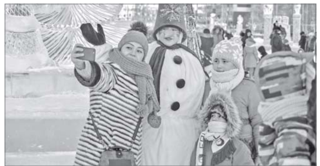
Сэлфи со снеговиком для инстаграм - первое дело в новом году.

Северная зима весёлых любит. Таких, которым дома не сидится, кто против любого мороза вооружён смехом, задором и оптимизмом. Нижневартовцы, что вышли в праздничные дни на концертные и игровые площадки, именно такие. Сами не скучали и других развлекали.