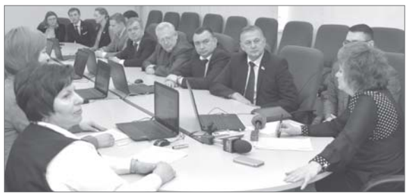
Высокие гости посетили лучшие в городе средние профессиональные учреждения.

Всё новое - это хорошо забытое старое, решили молодые парламентарии Нижневартовска и обратились к старшим коллегам с предложением возродить в городе традицию учебно-производственных комбинатов. Будут ли старшекласники вместе с аттестатом зрелости получать навыки востребованных профессий, народные избранники обещали всерьёз обдумать, а с приходом нового года разработали целый план мероприятий, чтобы понять, есть ли спрос, чтоб оправдать предложение.