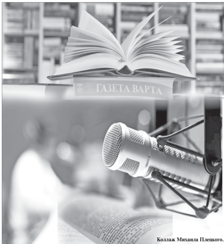
Коллаж Михаила Пещкого.