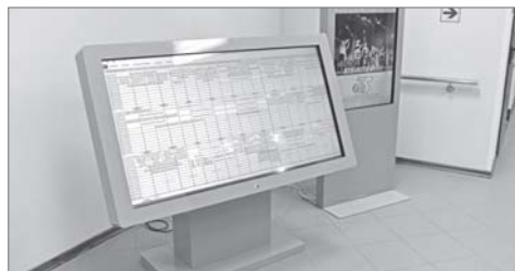
Интерактивное расписание - один из примеров компьютеризации образовательного процесса.

Особый интерес у молодых парламентариев вызвала техническая база и практическая сторона подготовки профильных специалистов. Наряду с новинками компьютерного прогресса - интерактивной панелью для изучения анатомии человека, где органы можно рассмотреть во всех проекциях, до манекенов в человеческий рост, симуляторов и тренажёров, с помощью которых будущие медики набивают руку.