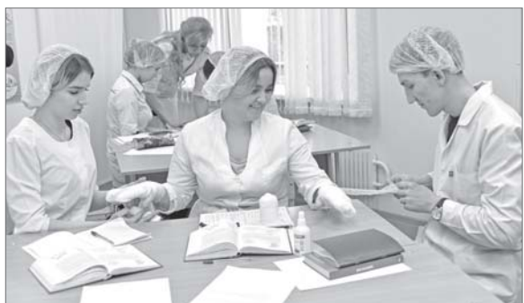
Студенты-медики в любой момент могут попробовать себя как в роли врача, так и в роли пациента, которому нужна помощь специалиста.