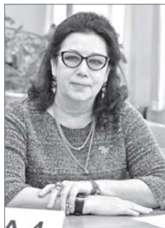
Математики Нижневартовска знают свой предмет на «отлично» и готовы передать эти знания детям.

Считайте, что это вызов, - говорит директор департамента образования администрации Нижневартовска Эдмонд Игошин в своём обращении к педагогам перед началом испытания. - Таким образом мы хотим дать свой ответ шумевшей истории с тестами Рособнадзора, доказав, что наши педагоги на 200% соответствуют своей квалификации. Некорректные данные бросают тень на профессию учителя. Убедён, что с вашей помощью мы вернём ей не только лицо, но и доброе имя, ведь в нашем городе педагоги-математики замечательно знают свой предмет и готовы передать эти знания своим ученикам.