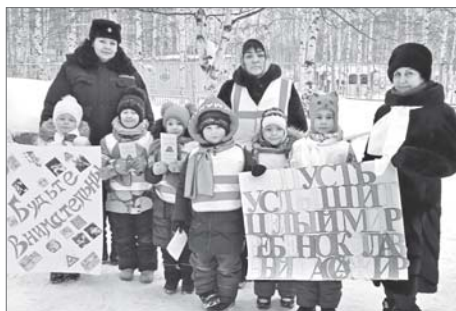
Во всех образовательных учреждениях города прошла профилактическая акция «Пусть услышит целый мир: ребёнок - главный пассажир!».

Этим утром маленькие волонтеры детсадовского отряда «Солнечные зайчики» попробовали себя в роли дорожных инспекторов. Поводом для рейда стала профилактическая акция «Пусть услышит целый мир: ребёнок - главный пассажир!», направленная на сохранение жизни и здоровья маленьких участников дорожного движения.