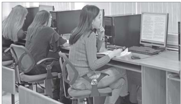
Первоклассные педагоги, новейшие образовательные программы, оборудованные практические кабинеты - в колледжах есть все, чтобы готовить профессионалов своего дела.

Первым пунктом повестки дня стало создание рабочей группы и объезд средних профессиональных учебных заведений Нижневартовска. Выездными заседаниями, посвящёнными заданной теме, был отмечен конец 2018 года. Вернуться к этому вопросу народные избранники решили в 2019 году. За какие заслуги социально-гуманитарный колледж называют кузницей эрудитов и почему медицинскому колледжу стало тесно в четырёх стенах отведённого им здания, на месте разбирался инициатор встречи - представитель Молодёжного парламента, специалисты департамента образования города и члены комитета по социальным вопросам Думы Нижневартовска.