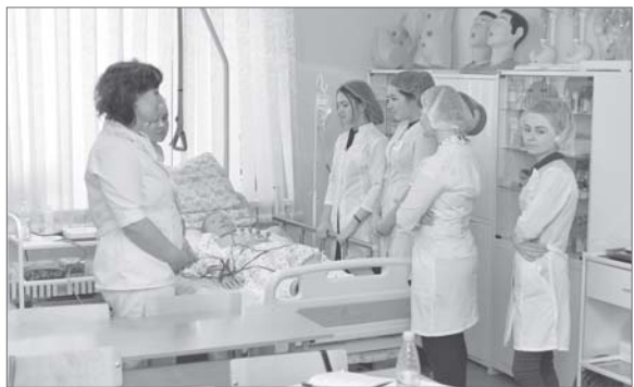
Манекены, специальные тренажеры-симуляторы - постигать азы профессии медики должны на практике, а не только в теории.

Всё новое - это хорошо забытое старое, решили молодые парламентарии Нижневартовска и обратились к старшим коллегам с предложением возродить в городе традицию учебно-производственных комбинатов. Будут ли старшекласники вместе с аттестатом зрелости получать навыки востребованных профессий, народные избранники обещали всерьёз обдумать, а с приходом нового года разработали целый план мероприятий, чтобы понять, есть ли спрос, чтоб оправдать предложение.