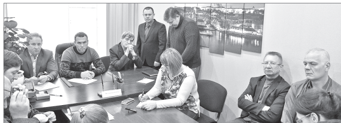
Департамент ЖКХ администрации Нижневартовска.