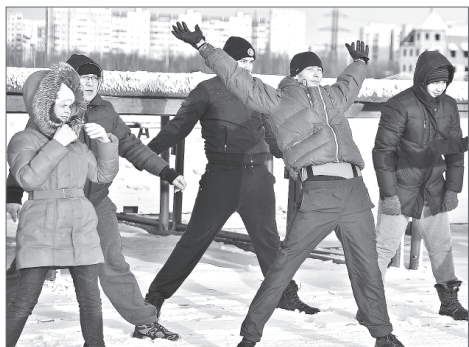
Управление по информационной политике администрации Нижневартовска. Фото Михаила Плещого.

В Нижневартовске продолжают бесплатные занятия спортом на свежем воздухе.