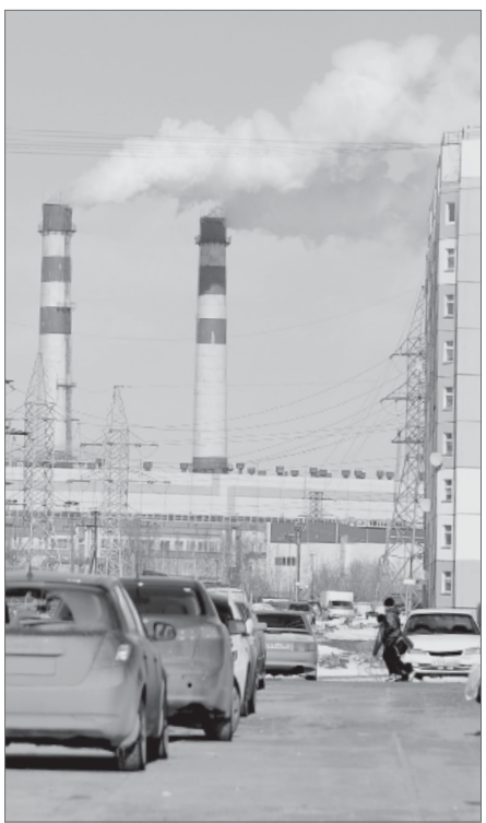
Римма Гайсина.

Пенсионер Салават Ш. интересуется: готовы ли ресурсоснабжающие организации Нижневартовска к форс-мажорным обстоятельствам? Все ли они имеют резервные источники питания? Специалисты «Теплоснабжения», «Горводоканала» и управляющих компаний дали ответ: все службы готовы на 100%. Если даже вдруг где-то случится перебой, тут же автоматически включится резервная система подачи жизненно важных для населения ресурсов, запас которых всегда на должном уровне. Есть единый план мероприятий, который ответственные лица знают наизусть, ежемесячно на каждом объекте проводятся специальные учения, плановые и внеплановые проверки. Представители ГО и ЧС также отметили, что и у них всё под контролем: имеется чёткий план действия, в постоянной готовности грамотный кадровый состав, все системы оповещения исправны.