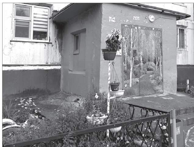
Клумбы на улице Интернациональной, 10-б.