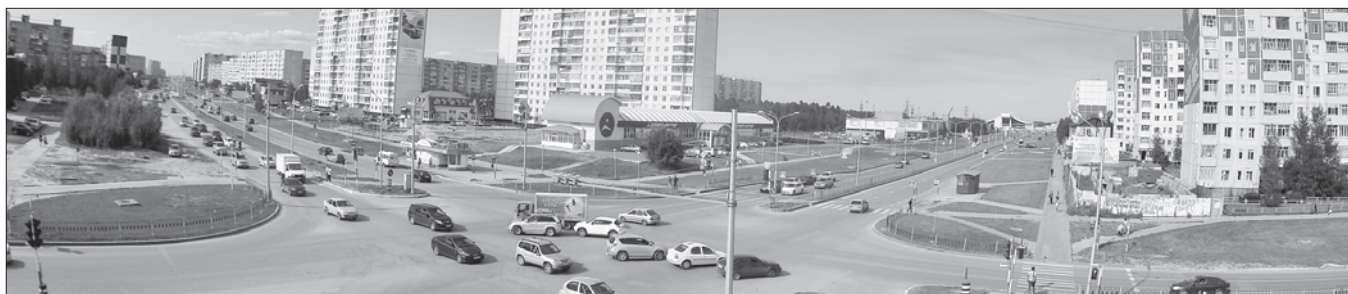
Письма читала Лидия Уфимцева.