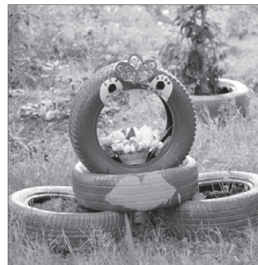
Клумбы на улице Ленина, 17-2.