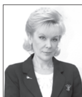
Алла Бадина, глава администрации г. Нижневартовска

-Цель поездки - посмотреть, насколько подрядчики, выигравшие конкурс, укладываются в сроки и насколько качество работ соответствует требованиям наших граждан.