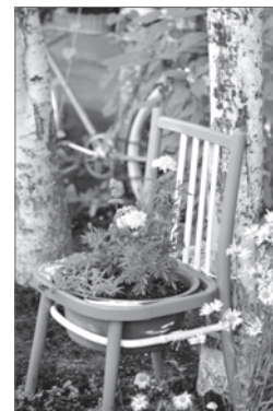
Клумбы на улице Интернациональной, 14.