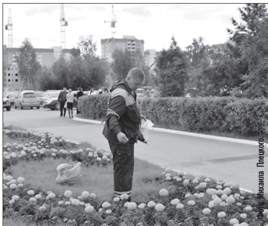
Нет, это не «Сеятель» Ван Гага и не «Аптекарь» Дали. На фотографии работник САТУ посылает удобрением городскую клумбу. Благодаря хорошему уходу бархатцы, петунии и бегонии цветут в нашем городе еще ярче.