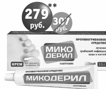
Микодерил крем 15 г

ИМЕЮТСЯ ПРОТИВОПОКАЗАНИЯ К ПРИМЕНЕНИЮ. НЕОБХОДИМО ПРОКОНСУЛЬТИРОВАТЬСЯ СО СПЕЦИАЛИСТОМ