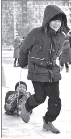
Веселые старты - шумный праздник со спортивным уклоном.

Кто сказал, что, когда уроки заканчиваются, школьный двор пустеет и замолкает? Организационный комитет дирекции спортивных сооружений взялся доказать обратное, объявив жителям 10-го микрорайона о начале шумного праздника «Зимние забавы», местом проведения которого была выбрана новенькая баскетбольная площадка школы №24.