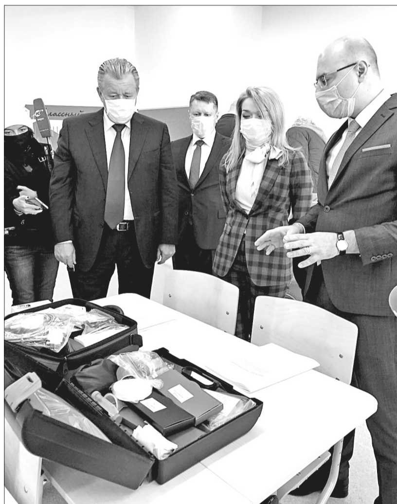
Кабинет химико-биологического (медицинского) профильного класса оснащён самым современным оборудованием.

На оснащение лицея средствами обучения и воспитания, необходимыми для реализации современных образовательных программ, предоставлена субвенция местному бюджету из бюджета Югры.