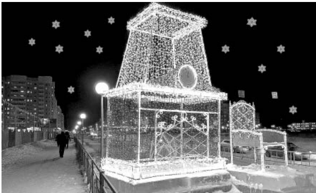
Снежная Королева уступила свой трон?