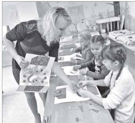
Скоро праздник, а лучший подарок маме – открытка, сделанная своими руками.