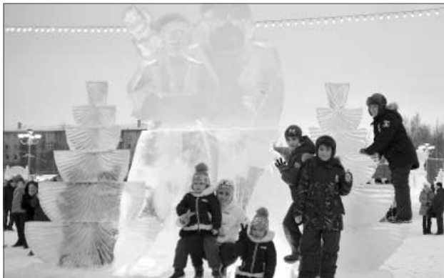
Ну как без Деда Мороза и Снегурочки!