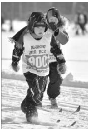
Как резвый ветер по гладкой лыжне!

Более 150 мероприятий запланированы в предновогодние и праздничные дни.