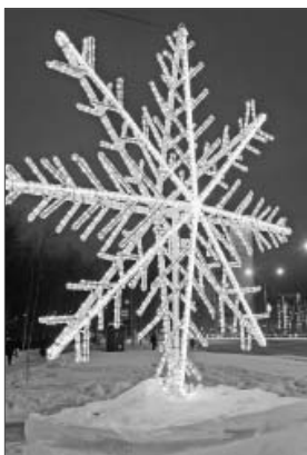
Вы к нам из космоса?

Три недели остаётся до праздничного боя курантов. Но так уж повелось в Нижневартовске, что ледовый городок на площади Нефтяников в нашем городе традиционно распахнёт ворота на неделю раньше, чтобы настроение праздничное у горожан создать. И сегодня работы здесь в самом разгаре.