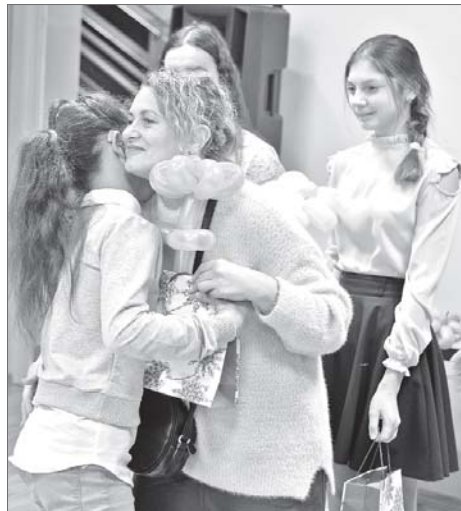
«Свежий ветер» – это семья, где каждый заботится друг о друге.

А пока собраться всем вместе – уже праздник, полный цвета, воздушных шаров, мастер-классов и подарков от воспитанников и педагогов творческих коллективов Центра детского творчества. И каждая улыбка здесь на вес золота. Дети мы остаёмся до тех пор, пока верим в сказку. Пока мечты получают своё воплощение благодаря добрым волшебникам – родителям, что бок о бок живут с нами рядом. Хочется, чтобы сахар в крови этих мальчишек и девчонок всегда был в норме, тогда и взрослые мечты о детском здоровье станут реальностью.