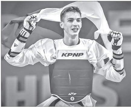
Круг почета: чувства словами не передать.