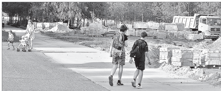
В пятом микрорайоне активно продолжаются работы по реконструкции Космопольского бульвара.