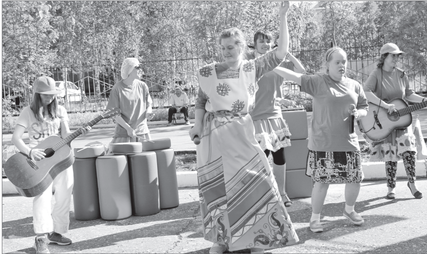
Благодаря постоянным занятиям и общению с окружающими воспитанники «САМИТ» стали более открытыми. Даже выступить перед аудиторией им теперь не страшно.

Они могли бы стать музыкантами, танцорами, учителями, журналистами, спортсменами... Однако судьба распорядилась по-другому. Болезнь забрала у них сотни возможностей. И каждый день за каждую новую возможность для своих детей с нарушениями развития самоотверженно борются их родители.