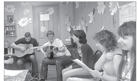
Ребята в клубе репетируют номер перед предстоящим концертом.