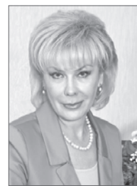
Алла Бадина, глава администрации города:

- Не просто так говорят, что Нижневартовск сам себя может прокормить - мы выпускаем много разнообразных и при этом качественных продуктов. Надеюсь, что и в следующем году, который будет юбилейным для нашего города, местные предприниматели снова приятно нас удивят.