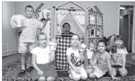
Детский сад №66 «Забавушка».

Подведены итоги «Всероссийского рейтинга детских садов-2015». Исследование подготовлено на основе методики, разработанной Институтом изучения детства, семьи и воспитания РАО. Рейтинг подготовили социальный навигатор МИА «Россия сегодня», Федеральный институт развития образования и Институт изучения детства, семьи и воспитания Российской академии образования при участии региональных органов управления образованием Российской Федерации.