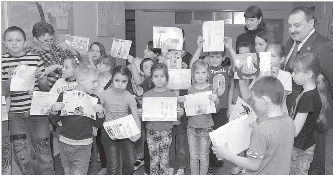
50 ребят из пришкольного лагеря школы №1 нарисовали любимый Нижневартовск.

О любви к городу можно рассказать в стихах. Или выразить свои эмоции в песне. А ребятам из школы №1 предложили признаться в чувствах к своему городу с помощью изобразительного искусства. В образовательном учреждении стартовал проект «Нарисуем город вместе», инициатором которого выступила общественная организация «Фонд «ЗАБОТА и УЧАСТИЕ».