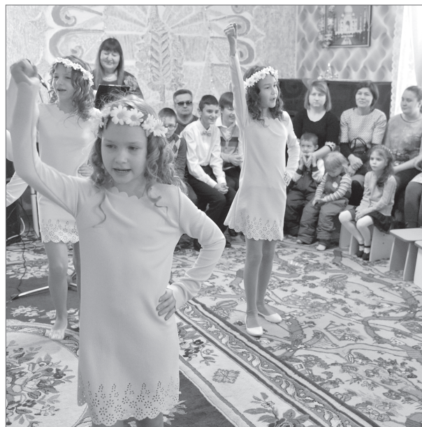
Группа «Настроение» специальной школы для детей с ограниченными возможностями порадовала гостей жестовым пением.

Почти домашний уют и душевное тепло. Особенную атмосферу чувствует каждый, кто переступает порог специализированного культурно-оздоровительного центра для семей с детьми с ограниченными возможностями «Добролей». Уникальное для Нижневартовска учреждение отметило свой первый день рождения.