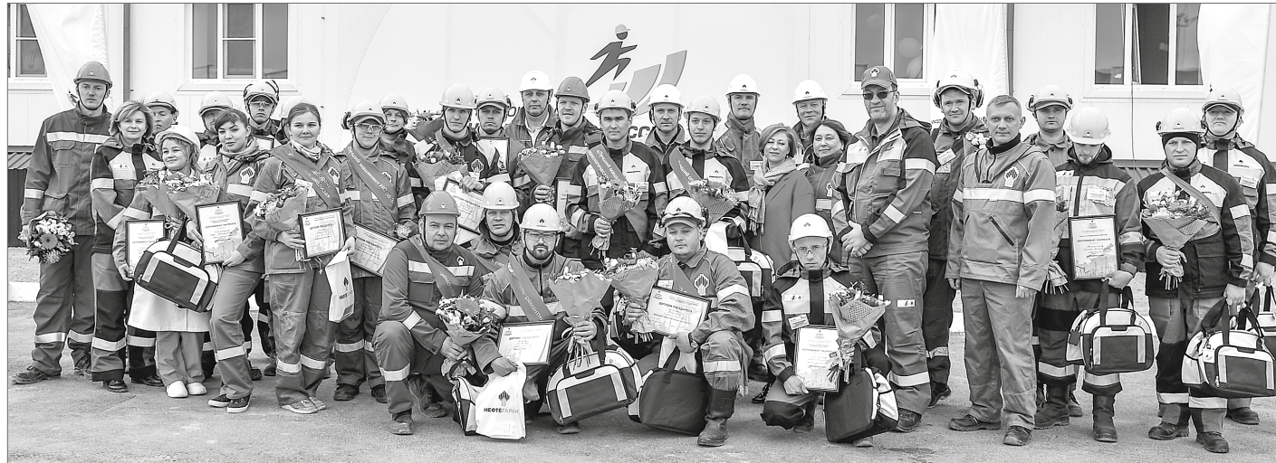
Те, кому в этот день удалось побороть волнение и проявить себя, празднуют победу.

В подарок к юбилею – праздник профессии. На производственных объектах группы предприятий «Варьёганнефтегаз» «НК Роснефть» в день 20-летия со дня образования Нижневартовского нефтегазодобывающего предприятия представители рабочих специальностей боролись за право носить звание «Лучшего по профессии».