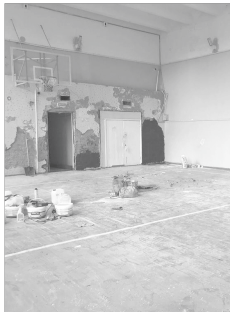
Департамент общественных коммуникаций и молодёжной политики администрации города Нижневартовска.