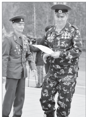
Соб. инф.

По интересующим вопросам обращаться по телефону 8 (3452) 29-25-40 либо по адресу: город Тюмень, улица Советская, 40 (отдел кадров).