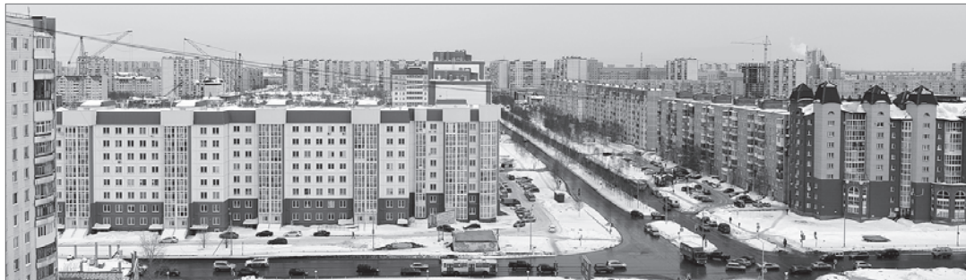
9 микрорайон в 2015 году.

- По прогнозам, население города за 20 лет увеличится примерно на 60 тысяч человек. Причём по большей части - за счёт естественного прироста. Ежегодно рождается как минимум 4 тысячи малышей, и родители рано или поздно хотят отдать их в детский сад. Что мы имеем на сегодняшний день?