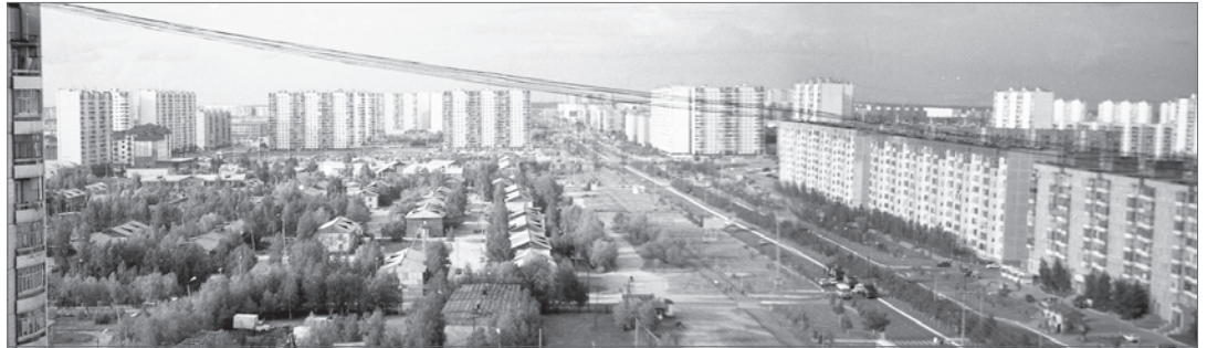
9 микрорайон в 1986 году.

ориентировочно увеличится жилая застройка к 2035 году.