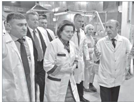
Наталья Комарова уверена в том, что государство должно субсидировать агропромышленный комплекс и перерабатывающую промышленность.