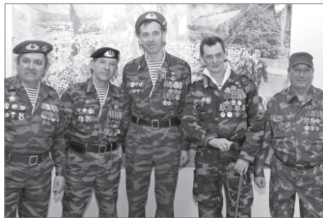
Боевое братство - это на всю жизнь.

Более шестисот молодых нижевартовских парней достойно выполнили свой воинский долг, служа в Афганистане. Многие получили ранения, 14 человек вернулись инвалидами, а шесть наших земляков, к сожалению, погибли. День 15 февраля 1989 года поставил точку в той войне, продолжавшейся больше 9 лет. Каждый год в эту дату нижевартовские воины-интернационалисты собираются, чтобы почтить память боевых товарищей.