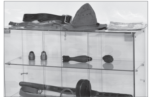
Сегодня - это лишь музейные экспонаты.