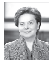
Наталья Комарова, губернатор ХМАО - Югры.

Руководитель региона, бывая в муниципальных образованиях, не только проводит совещания и встречи, но и обязательно посещает предприятия местной промышленности. На них создаются дополнительные рабочие места, налоги пополняют бюджет, а население получает возможность выбирать товары на свой вкус, и региональная власть заинтересована в том, чтобы малый и средний бизнес процветал и развивался.