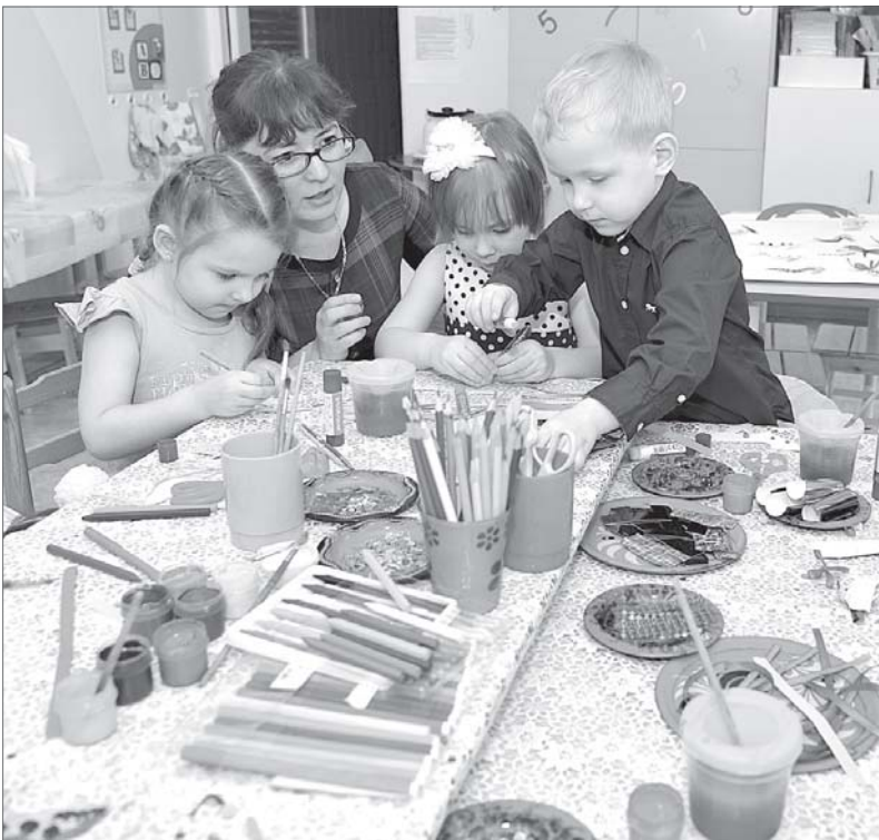
Дополнительные средства выделены на открытие групп раннего развития.