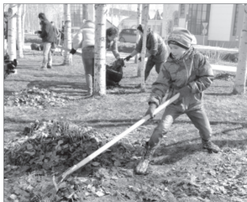
Юные вартовчане принимают активное участие в общегородских субботниках.