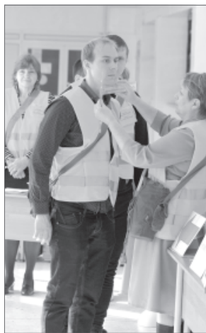
МКУ Нижневартовска «Управление по делам ГО и ЧС».

Программа тренировки включает: - оповещение руководящего состава гражданской обороны города; - проведение заседаний комиссии по предупреждению и ликвидации