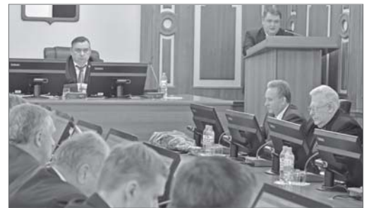
Депутаты Думы города одобрили изменения в муниципальный бюджет.

Доходная часть бюджета города увеличилась почти на 905 млн рублей. На заседании Думы депутаты одобрили изменения в главном финансовом документе муниципалитета. Городская казна пополнилась за счёт федеральных и окружных средств, налоговых отчислений и поступлений от предприятий в рамках соглашения о социальном партнёрстве.