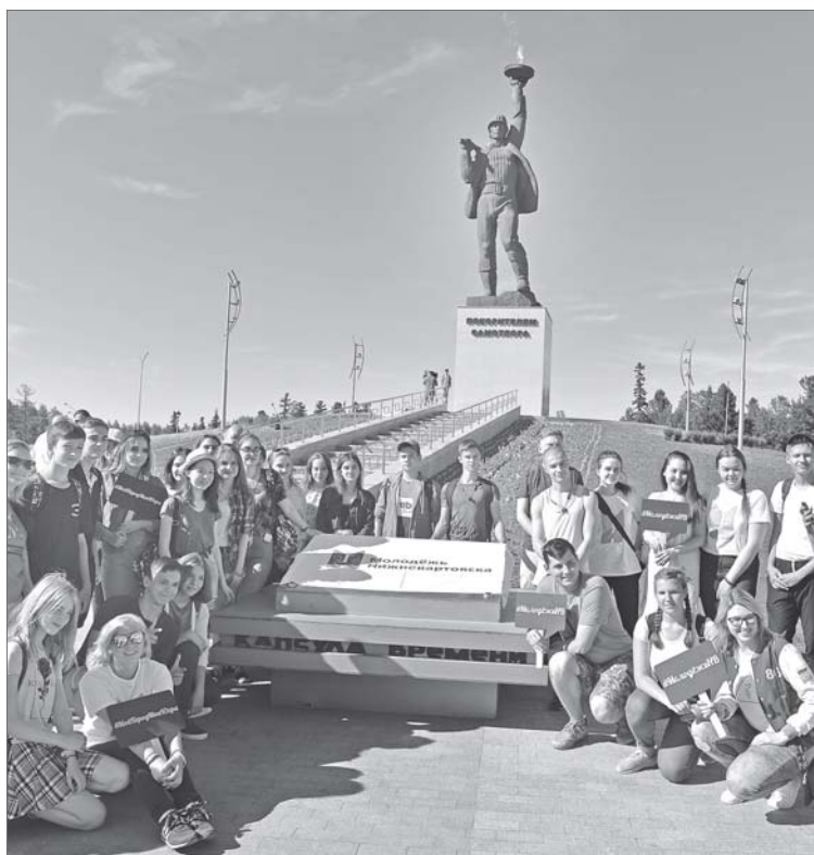
Волонтеры Нижневартовска готовятся заложить новую капсулу времени - послание в будущее.