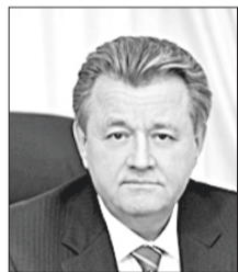
Василий Тихонов, глава города.

Сердечно поздравляем вас с наступающими новогодними и рождественскими праздниками! Эта волшебная пора объединяет нас общими надеждами и ожиданием радостных перемен. С самого детства новогодние дни дарят ощущение чуда, прекрасное настроение и заряжают положительными эмоциями.