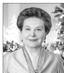
Наталья Комарова, губернатор ХМАО – Югры.

Завершается 2020 год. Он стал испытанием для каждого из нас, каждой семьи в мире. Изменён привычный уклад жизни. Нас проверили на прочность, на верность нашим принципам, целям. Неизменными остаются наша сплочённость, вера в друзей, родных, близких, стремление добиться результатов.