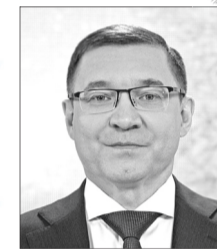
Владимир Якушев, полпред Президента РФ в УрФО.

Заканчивается 2020 год. Каждому из нас он памятен по-своему. Но есть в жизни страны и важные события, которые сделали окружающий мир другим. Мы вспоминаем эти события, встречи и моменты. И особенно тех, кто был рядом с нами, помогал и поддерживал. Это был Год памяти и славы, 75-летия Победы в Великой Отечественной войне. Для ветеранов Великой Отечественной войны и тружеников тыла это особая дата. Это их жизнь и их подвиг. Мы в вечном долгу перед ними и должны и дальше оказывать им всемерную помощь. Для всех жителей России и Уральского федерального округа в уходящем году огромное значение имел референдум по поправкам к Конституции Российской Федерации, инициированный президентом страны Владимиром Путиным. Он показал силу сплочённости и поддержки главы государства со стороны подавляющего большинства жителей России.