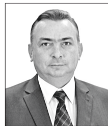
Максим Клец, председатель Думы города.