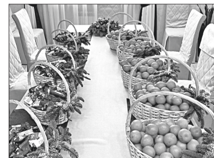
Департамент общественных коммуникаций администрации г. Нижневартовска.

Добавим, что свои поздравления с предстоящими праздниками врачам, работающим в «красной зоне», направляли творческие коллективы, воспитанники образовательных и спортивных организаций. От имени руководителя муниципалитета коллективам переданы праздничные наборы с фруктами и конфетами.