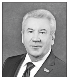
Борис Хохряков, председатель Думы ХМАО – Югры.

От имени депутатов Думы Ханты-Мансийского автономного округа – Югры и от себя лично искренне рад поздравить вас с Новым годом!