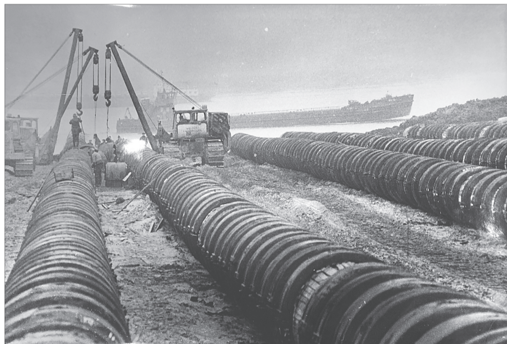
Начало нефтяной реки Самотлора.