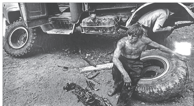
Человек для Альберта Лехмуса – титан, бог труда.