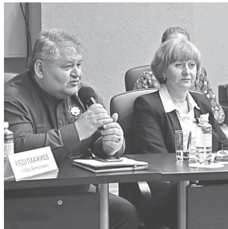
Департамент общественных коммуникаций и молодёжной политики администрации г. Нижневартовска.

Добавим, впервые заседание Координационного совета по взаимодействию с общественными объединениями, представляющими интересы этнических общностей, и религиозными объединениями при главе города проводилось в расширенном составе. В числе его участников были представители департамента внутренней политики ХМАО – Югры и ряда муниципальных образований округа.