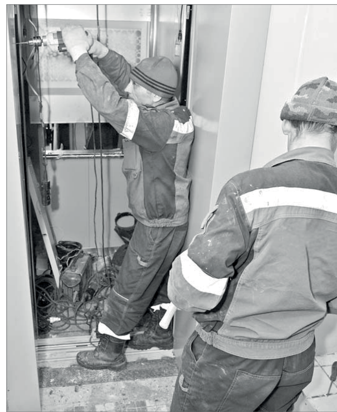
Капремонт лифтового оборудования – дело хлопотное.

Более того, постоянно переносить работы по замене изношенных лифтов не представляется возможным, исходя из элементарных соображений безопасности людей, проживающих в этом доме», – отметил специалист фонда. Добавим, что в доме №9 на улице 60 лет Октября капремонт – это не только замена лифтового оборудования, но и ремонт системы теплоснабжения.