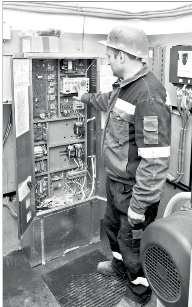
В машинном отделении проводится диагностика.

Капремонт в многоквартирных домах в Югре, в том числе и в Нижневартовске, проводится точно в сроки, указанные в окружной программе капитального ремонта. А собственник должен вовремя подтвердить виды запланированных работ и высказать свои предложения.