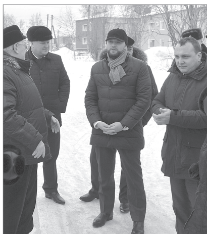
Рабочая поездка членов комитета по городскому хозяйству и строительству.