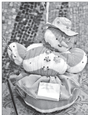
Арина Арсеньева.

Положение о конкурсе и бланк заявки для участников размещены на сайте Дворца искусств (раздел «Конкурсы»).