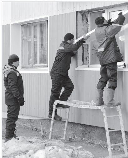
За качеством капремонта жители могут следить сами.

Общественная и депутатская работа имеют много общего, так как в центре - интересы других людей.