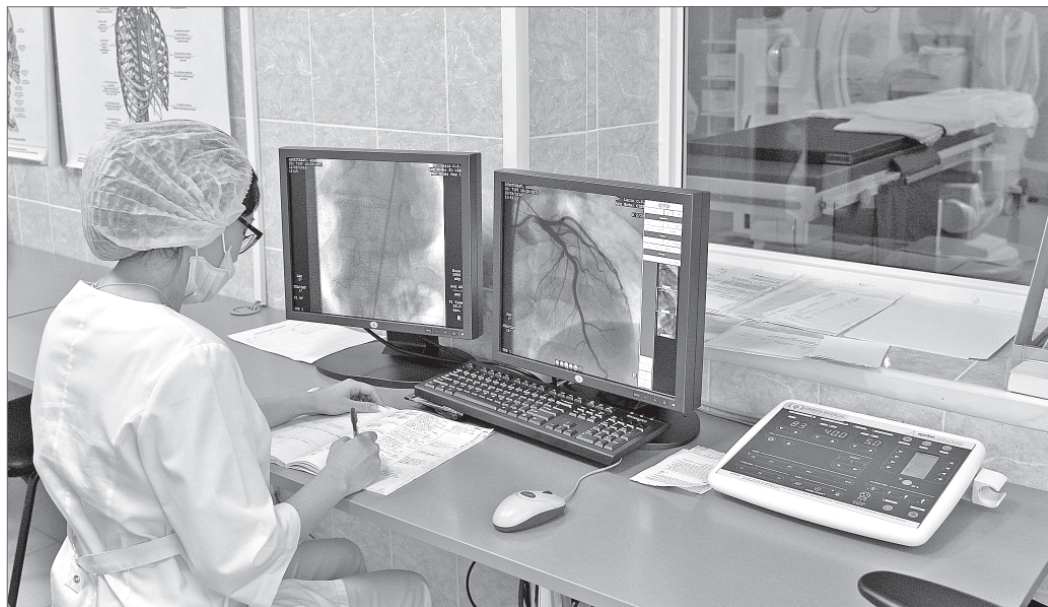
В Нижневартовский региональный сосудистый центр входят два отделения: кардиологии и рентгенохирургических методов диагностики и лечения. Прием пациентов ведут высококвалифицированные специалисты, работающие на новейшем современном оборудовании. Предполагается, что ежегодно здесь будут проходить лечение около тысячи человек.

депутат Думы города, заместитель главного врача окружной клинической больницы.