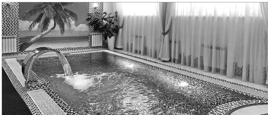
В отделении психотерапии и неврозов Нижневартовской психоневрологической больницы.