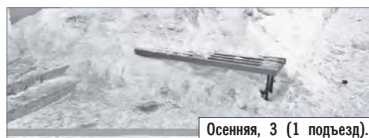
Осенняя, 3 (1 подъезд).