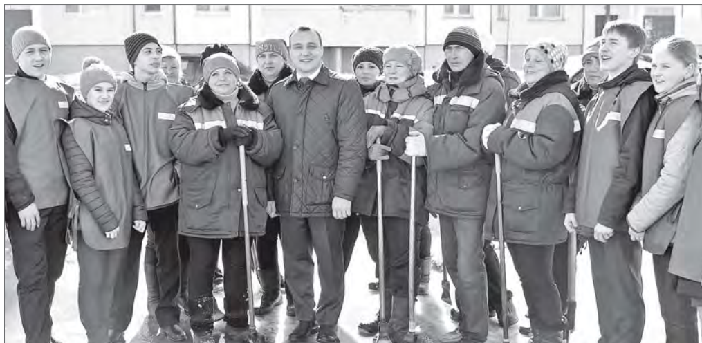
Вместе мы сделаем больше - уверены участники проекта «Красивый Нижневартовск».

Ухоженным, чистым и уютным мечтает видеть свой двор и микрорайон каждый житель Нижневартовска. Но одного желания недостаточно. Старшеклассники ряда школ города теперь это точно знают. Ребята, ставшие участниками городского проекта «Красивый Нижневартовск», уверены, что образцовое благоустройство требует от нас и заботы, и участия.