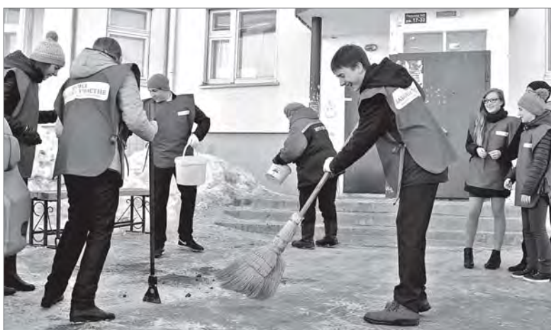
Красота города в наших руках!