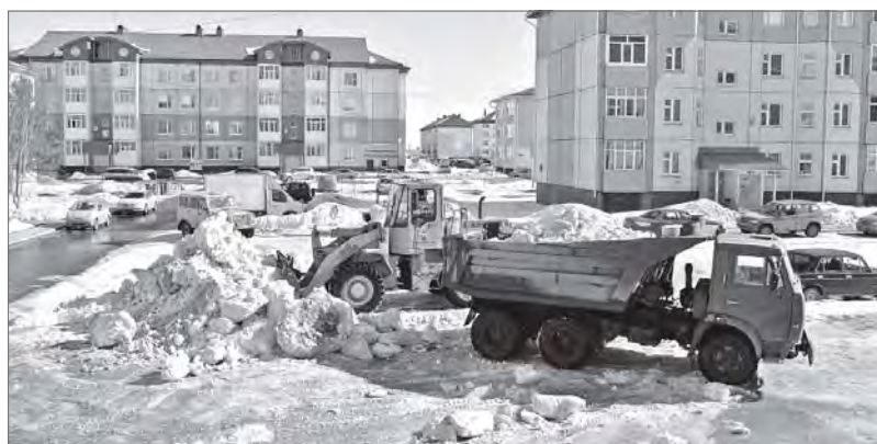
На этом месте была большая куча снега. Теперь его не узнать.

Коммунальщики тоже не подкачали - включились практически молниеносно. Первым делом избавились от потенциально опасных нарушений. Большое беспокойство старшеклассников вызывали горы снега, которые облюбовали детишки помладше. Малышня каталась с таких гор, всякий раз рискуя полость под колёса проезжавших рядом машин. Эти опасные «горки» были тут же убраны.