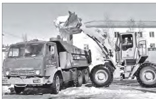
Снег из микрорайона отправляется на полигон.

Под девизом «Красота города в наших руках» проект стартовал в первой половине марта по инициативе общественной организации «Фонд ЗАБОТА и УЧАСТИЕ». Первопроходцами выступили восьмиклассники школы №17. Они с ходу подхватили идею и стали её реализовывать. На первом этапе, вооружившись фотоаппаратами, ребята отправились на прогулку по окрестному микрорайону 2П. Снимали как хорошие примеры благоустройства - огороженные детские площадки, очищенные от снега крыши, так и огорчительные - не вывезенные кучи снега, припаркованные в зелёной зоне автомобили, подъезды без урн и скамеек.