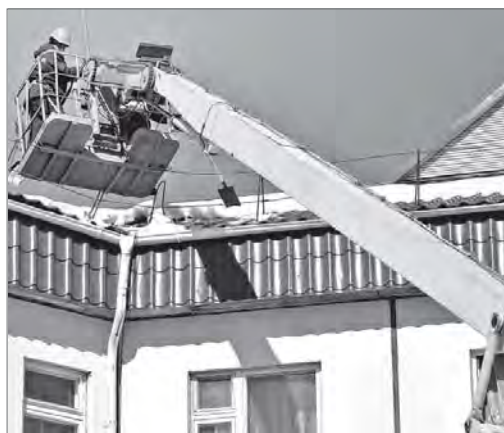
Снег с крыш долой!

заместитель директора Управляющей компании №1, поддержал проект одним из первых.