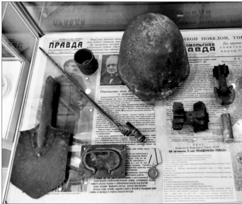
Музей Нижневартовского университета. Выставка «Помним, чтим, гордимся».