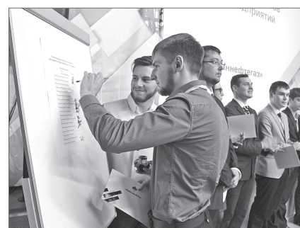
Написать свое имя нефтью - внести его в историю развития отрасли.

- Ребята большие молодцы, они собрались, весело взялись за дело, и результат не заставил себя ждать: получились очень информативный и динамичный ролик, - заключила начальник отдела социальных программ и корпоративной культуры.