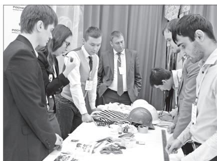
За полтора часа молодым нефтяникам предстояло освоить новое дело и создать рекламный ролик.

- Мы рады, что вы связали ваше будущее именно с группой предприятий «Варьёганнефтегаз», но только от вашего старания, от вашего умения, смелости мыслить нестандартно зависит ваша карьера, - напутствовал он молодых специалистов.