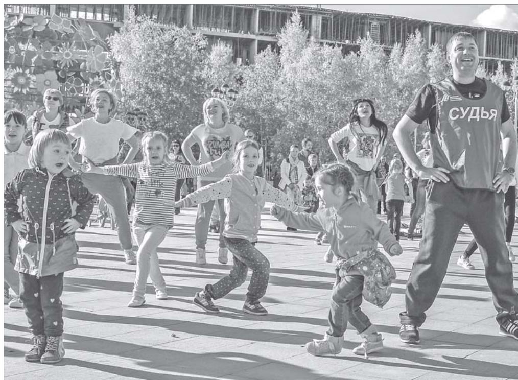
Кто делает зарядку по утрам, однозначно поступает мудро. А те, кто становится на массовую физкультурминутку, уже задают тон всему городу: «Будь, как мы! Будь лучше нас!»