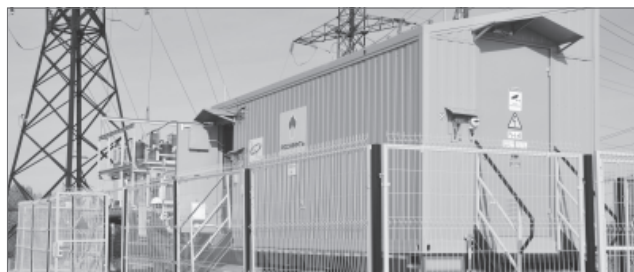
Альбина Мусина.