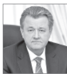
Василий Тихонов, глава города.

- Строительство данного участка является важным для города, так как новые микрорайоны в настоящее время активно застраиваются. Кроме того, эта дорога в дальнейшем должна соединиться с улицей Интернациональной, открывающей выезд на другие межмуниципальные дороги. И это не единственный проект. Впереди - продолжение строительства дороги по улице Нововартовской. Проект будет реализован в рамках концессионного соглашения. Договорённости с инвестором, готовым вложить средства в строительство дороги, достигнуты. Это не только разгрузит существующие транспортные магистрали, но и создаст условия для развития жилищного строительства на пока ещё новых, незастроенных территориях.