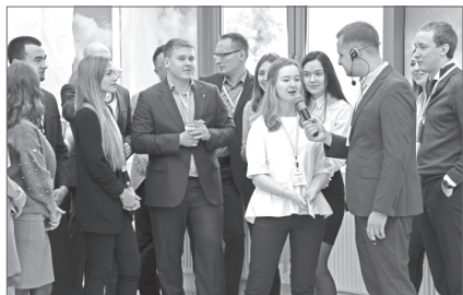
Молодые нефтяники поделились планами на перспективу.

Посвящение в нефтяники - давняя традиция предприятия, призванная показать тем, кто начинает профессиональный путь: здесь они нужны, на них возлагают надежды, от них ждут свершений и рассказать о том, что было до них, об истории и производственных достижениях и о том, на какую поддержку могут рассчитывать новички.