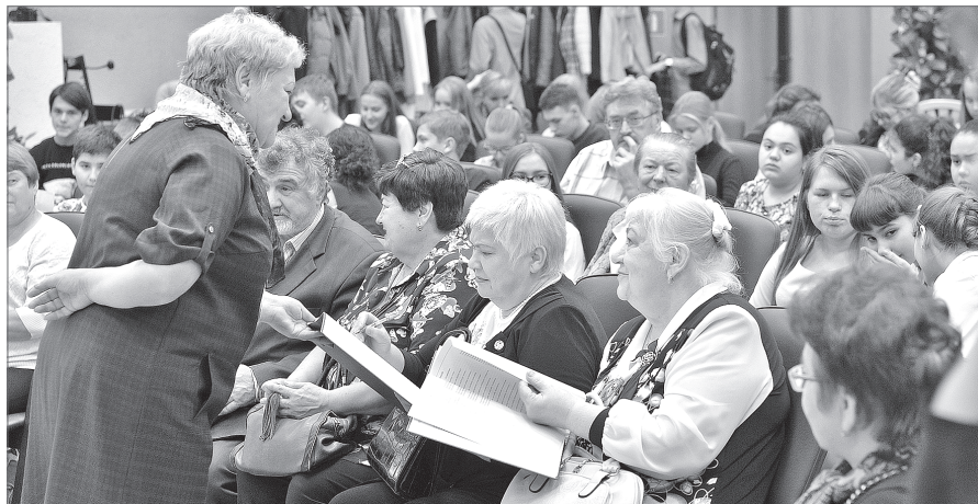
Гости мероприятия с интересом изучали новую книгу и брали автографы.