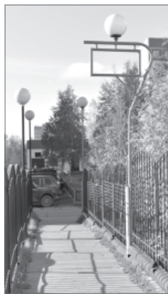
У каждого жителя города есть возможность улучшить свой двор, микрорайон.