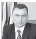
Максим Клеп, председатель Думы Нижневартовска.

Среди важных решений прошедшего политического сезона - принятие положения о принципах организации и работы территориального общественного самоуправления. Народные избранники также одобрили дополнительные меры социальной поддержки несовершеннолетних, зарегистрированных в приспособленных для проживания строениях после 1 января 2012 года. Депутаты Думы города своевременно вносили корректировки в муниципальный бюджет. Благодаря этому дополнительные финансы, поступающие в общегородскую казну, сразу направлялись по своему целевому назначению.