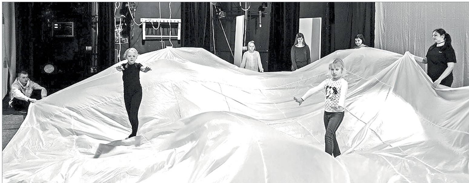
Репетиция спектакля «О синей птице».

Спектакль «О синей птице» инклюзивного театра – творческой лаборатории «Возрождение» стал главным событием детского праздника, организованного в Нижневарттовском ТЮЗе, бывшем театре кукол «Барабашка».