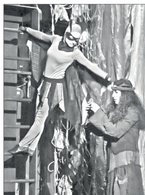
Сцена из спектакля «Кошка, которая гуляла сама по себе».

Социально значимый проект осуществляется на средства Гранта Департамента общественных и внешних связей ХМАО – Югры.