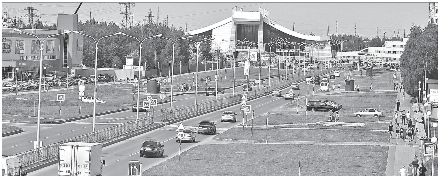
На улице Чапаева убрали воздушные линии, так что в этом плане город соответствует требованиям безопасности.