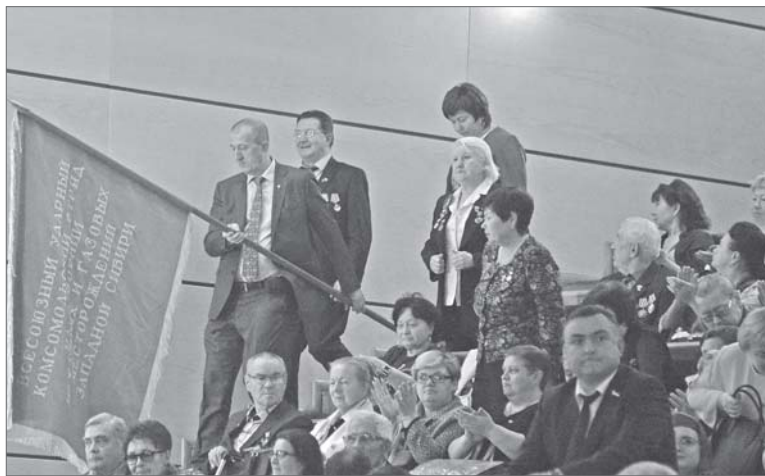
Комсомольцы сохранили свои знамена!

- Ну, а как же? - то и дело слышатся радостные возгласы. Некоторые даже не поленились прихватить книжицы с собой.