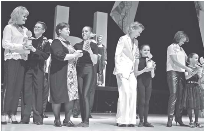
«Когда меня не станет, я буду петь голосами моих детей и голосами их детей».

Дворец сохранил своё название - «Октябрь», оставил неприкосновенным мозаичное панно «Покорителям Сибири и огня». Ну а такое искусство можно встретить в наши дни разве что на станциях Московского метрополитена.