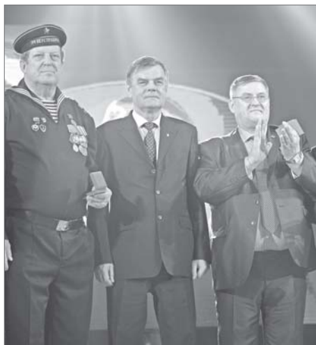
Ветераны нижневартовской комсомольской организации.

- ВЛКСМ - нескончаемый перечень трудовых подвигов. Это начало трудовой биографии сотен миллионов ребят. Это наша юность, наша гордость, наша слава! - звучали поздравления председателя Думы города Нижневартовска Максима Клеца.