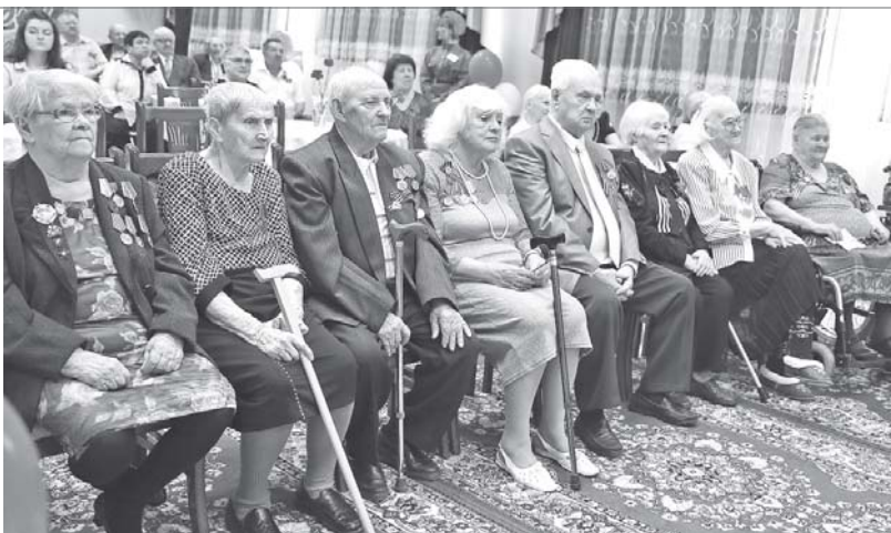
Ветеранов часто приглашают на концерты.

Ханты-Мансийский автономный округ отправил на защиту Родины свыше 17 тысяч мужчин и женщин. Каждый восьмой житель округа не вернулся с войны. Тяжёлая работа по восстановлению народного хозяйства легла на плечи женщин и детей. Сегодня они тоже ветераны. В Югре о них заботятся, предоставляя все меры медицинской и социальной поддержки.