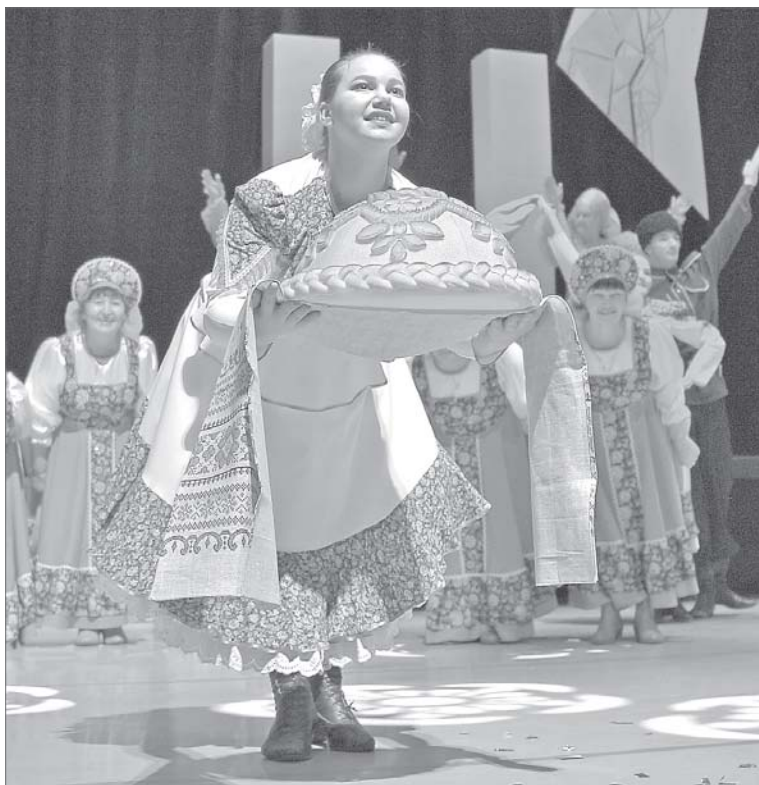
Во Дворце культуры «Октябрь» всегда рады гостям.

Дворцу культуры «Октябрь» исполнилось сорок. Его юбилей собрал полный зал гостей, зрителей, так или иначе причастных к истории одного из крупных учреждений культуры Нижневартовска. Многие помнят, как не хватало таких объектов молодому городу, как вначале строили здание для кинотеатра и всем миром решали, как его назовём, остановившись в итоге на «Октябре».